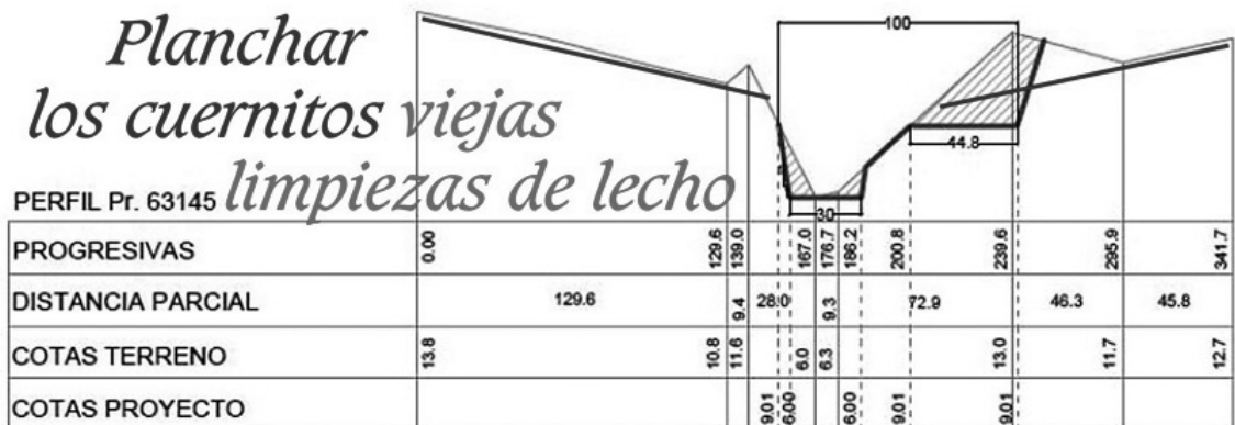
a) Sección en curva horaria